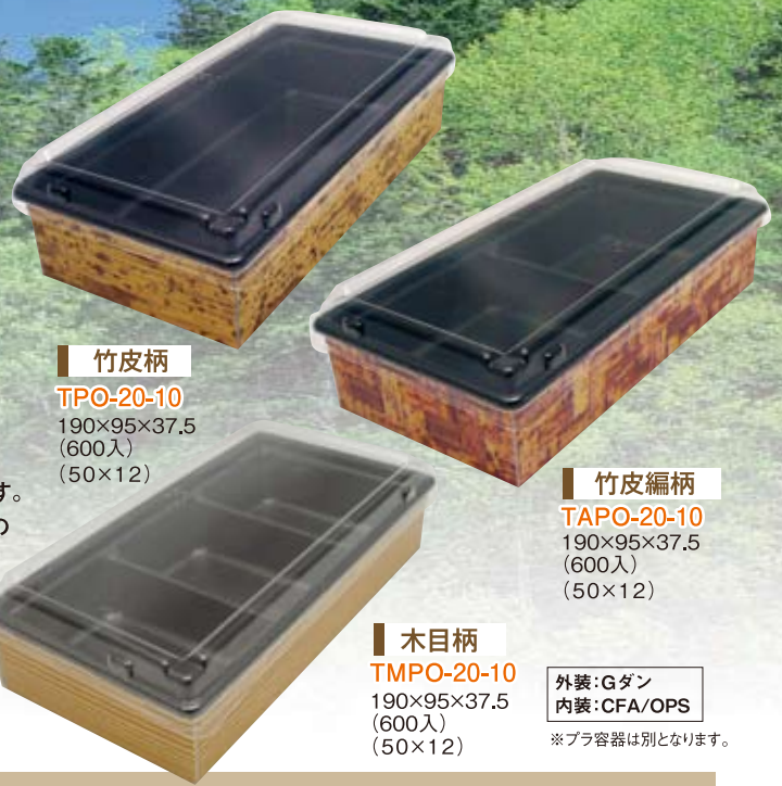
竹皮柄 TPO-20-10 190×95×37.5 (600入) (50×12)

ワンプラ折はプラ容器の機能性と紙が持つ温かみをコンビネーションした新感覚製品です。だれでも、カンタンに「ワンタッチ」で取り外しができますので、在庫スペースの圧縮やゴミの軽減化にも寄与し、現場での作業効率を高められます。また紙製品では難しいとされた「水気の多いメニュー」への提案を可能にしています。スリーブ感覚で使用いただけ、それだけで完成品となりますので過剰包装を無くし、費用対効果を発揮した特許取得製品です。